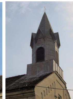
po rekonstrukci 2006