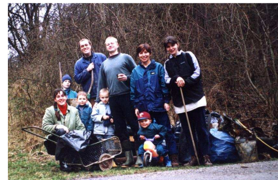
každoroční jarní úklid Libinského potoka, úklidová četa - jaro 2002

ČINNOST NEVÝDĚLEČNÝCH ORGANIZACÍ PATŘÍ KE KAŽDÉ SLUŠNÉ SPOLEČNOSTI, PROSTŘEDKY DO NÍ VYNALOŽENÉ SE NÁM VRÁTÍ NEJEN VE FORMĚ OSOBNÍHO USPOKOJENÍ, ALE I SPOKOJENĚJŠÍHO ŽIVOTA NAŠÍ SPOLEČNOSTI.