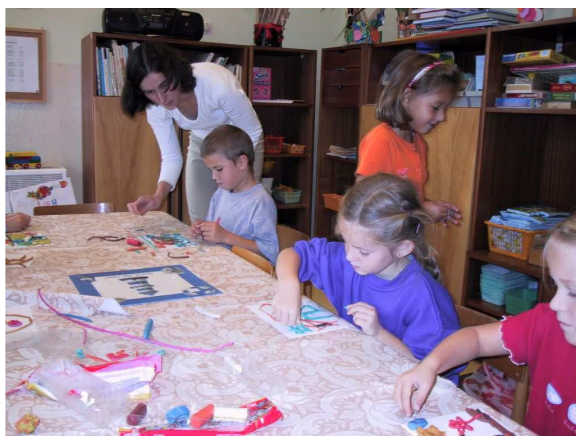
Výtvarný kroužek a výtvarné dílny v MŠ Ledňáček Hýskov roky 2003-2005