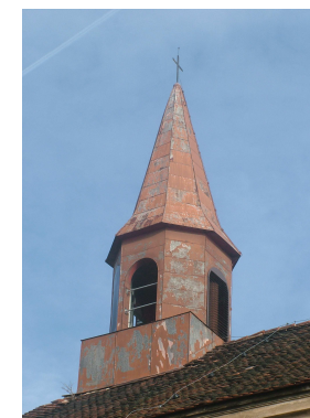
před rekonstrukcí 2002